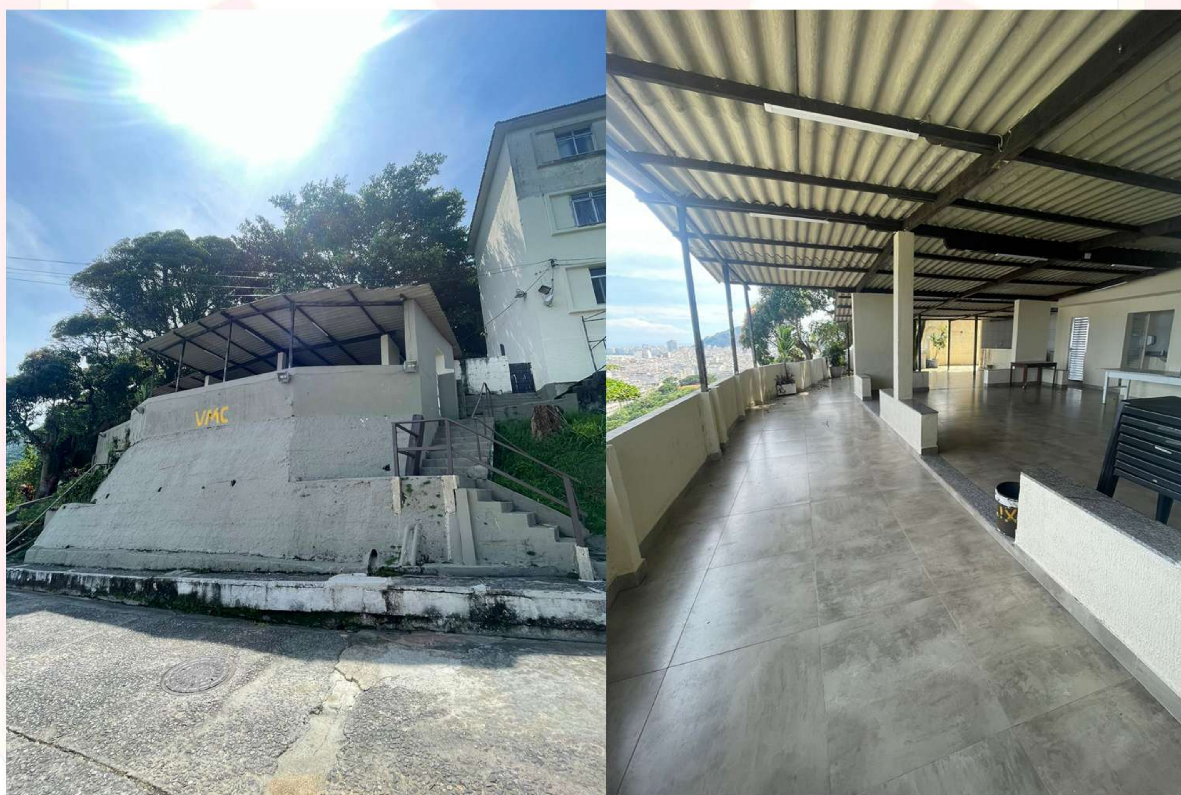
Salão de festa da Vila Militar de Copacabana