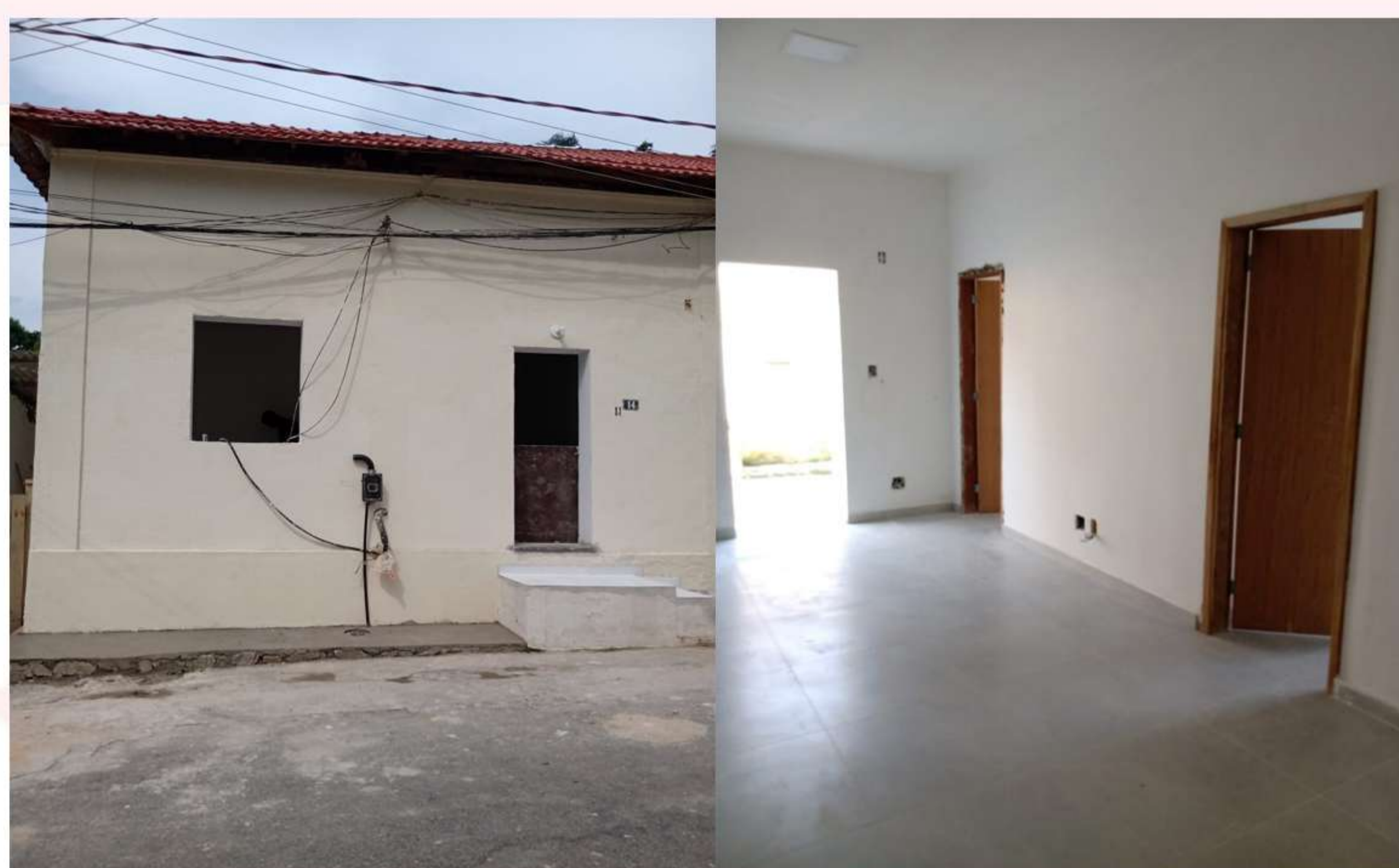
Restauração de PNR localizado na Ilha de Bom Jesus

Além disso, na Vila Militar de Copacabana, foram efetuadas reformas na área de lazer localizada na Rua Coelho Cintra, bem como no salão de festas da Vila Militar de Copacabana. Essas intervenções visam não apenas elevar o padrão de qualidade dos espaços de convívio, mas também contribuir para o bem-estar e a satisfação dos moradores, promovendo um ambiente mais agradável à Família Militar.