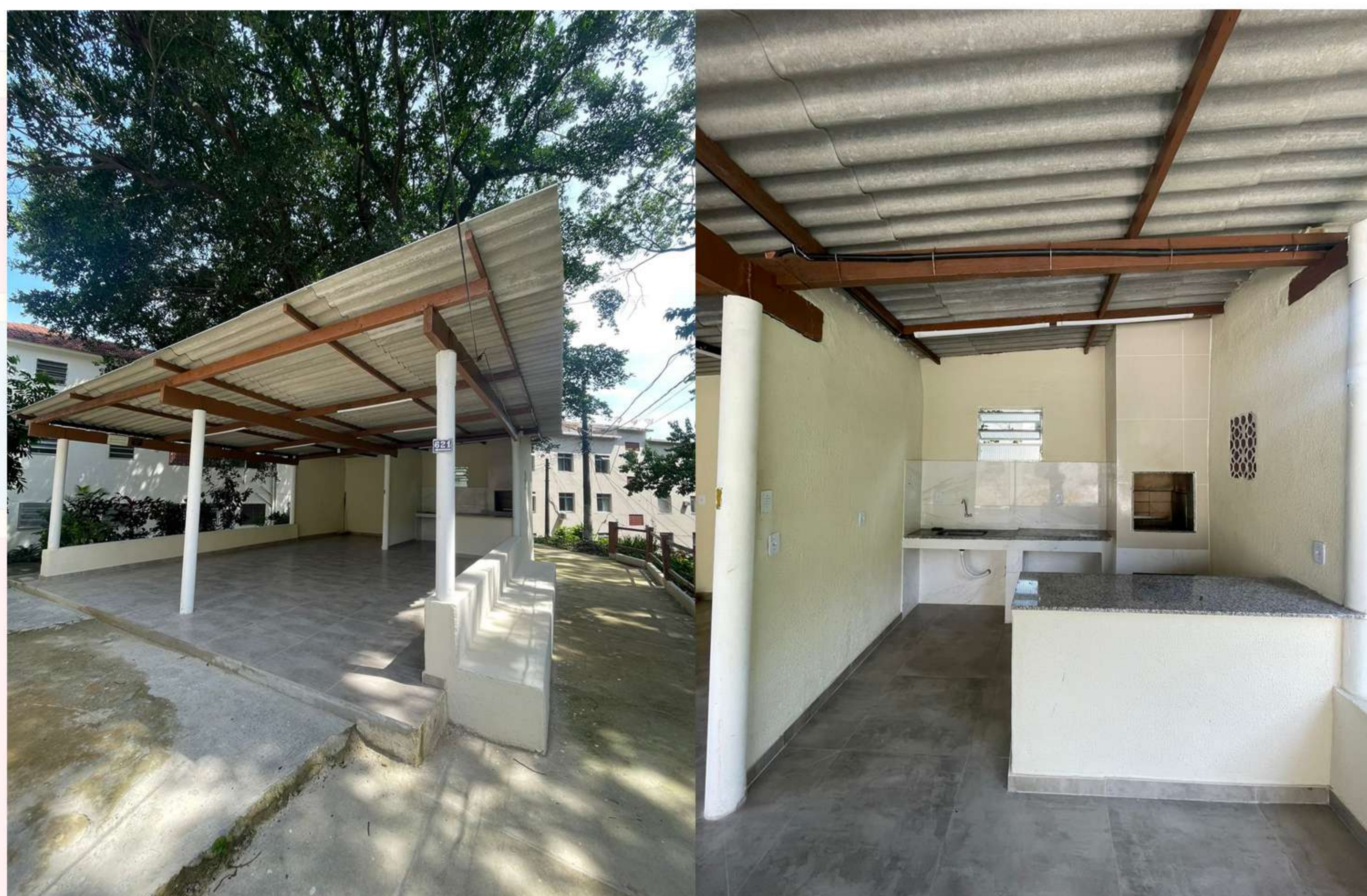
Área de lazer da Rua Coelho Cintra